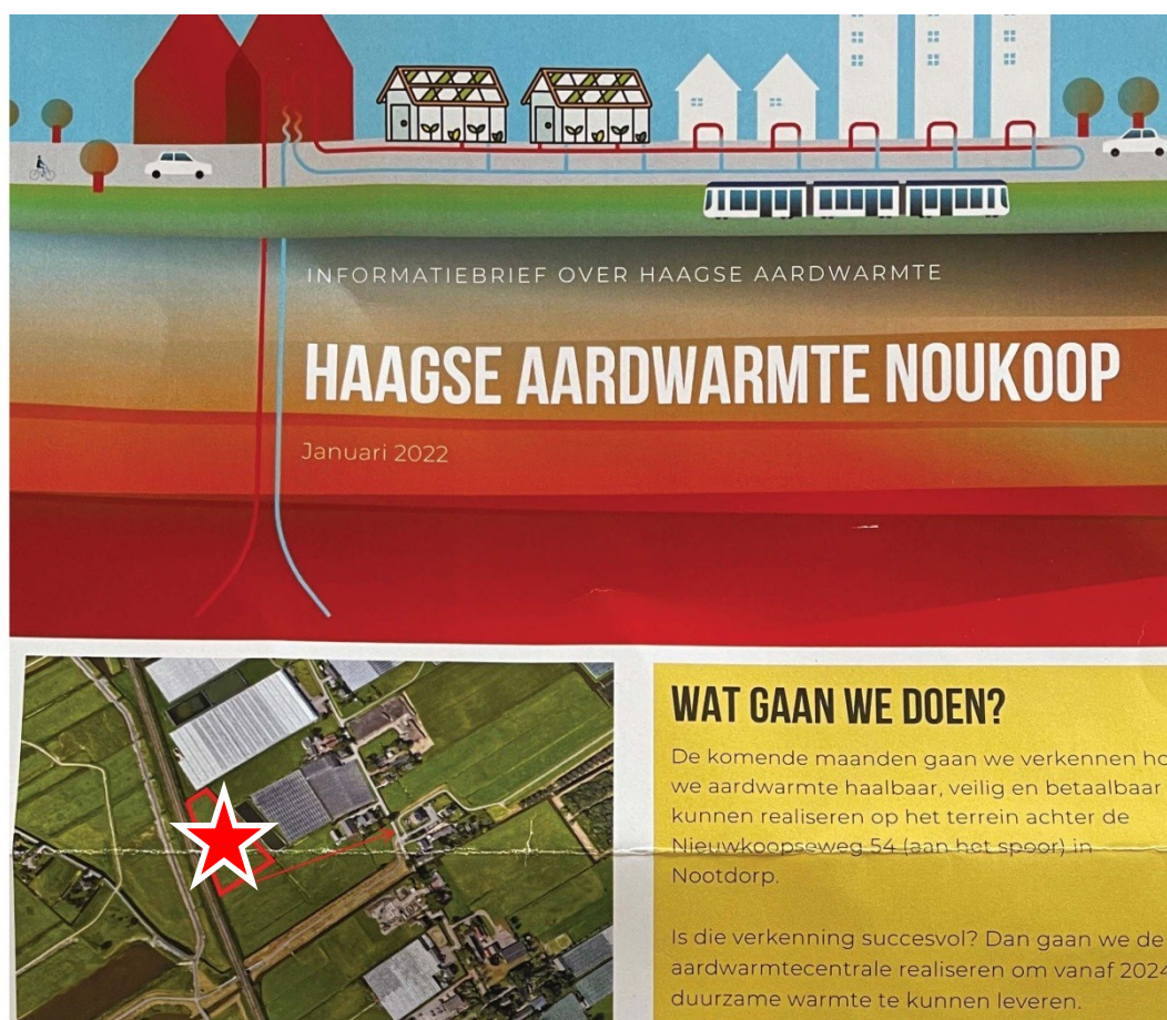
Figuur 1: informatiebrief van Haagse Aardwarmte inzake aardwarmtecentrale in Nootdorp met de boringlokatie

Wat u zich niet realiseert, wat niet verteld wordt en wat niet beschreven staat in de toelichting van het BP is dat er verregaande plannen zijn van de Haagse Aardwarmte BV om een deel van het gebied binnen het bestaande BP gelegen aan de Noukoop zijde van de Spoorlijn Den Haag - Rotterdam in te richten als aardwarmte centrale.