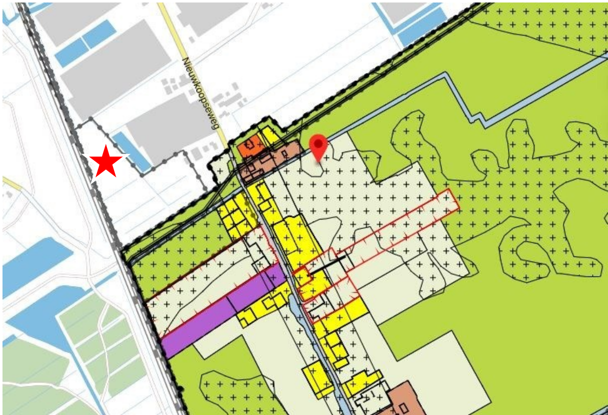
Figuur 3: digitale plankaart BP Katwijk en Nieuwkoop

Precies op deze kwetsbare vernauwing te midden van alle genoemde natuurgebieden worden de percelen grond in het bezit van ████████ onttrokken aan het voorliggende ontwerp bestemmingsplan. De redenen zijn duidelijk, aangezien ████████ de grond reeds verkocht heeft aan Haagse Aardwarmte BV. Binnen het bestemmingsplangebied 'Duurzame Glastuinbouwgebieden' (Noukoop) kan zonder aanpassing van het bestemmingsplan en hiermee verband houdende waardevolle belangenafweging in de gemeenteraad op de aangegeven plek een aardwarmte centrale gerealiseerd worden.